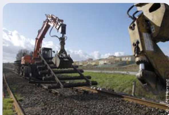
Travaux vers L'Isle-Jourdain

le Lot et dans le Gers entre Toulouse et Gimont. La section Gimont-Auch sera achevée à une période ultérieure. En 2009, les chantiers de renouvellement des voies concernent Tarascon-Latour de Carol (mars-juin), Tessonnières-Rodez (juin-octobre) et Saint-Sulpice-Mazamet (octobre-janvier 2010). A terme, 550 km de voies et ballast seront renouvelés, 10 liaisons pourvues d'installations techniques modernisées, 3 sections de lignes doublées et la gare de Toulouse Matabiau modernisée pour répondre à l'augmentation du trafic.