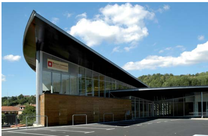
La Maison Commune Emploi-Formation de Decazeville