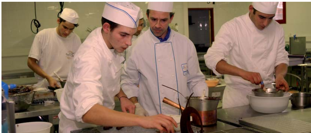
Apprentis au CFA de Muret

Le plan régional de développement des formations (PRDF) 2007-2011 va guider les ouvertures et fermetures de classes et de sections dans les lycées et CFA. Il sera ancré sur la réalité des territoires régionaux.