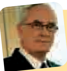
Martin Malvy, Président de Région